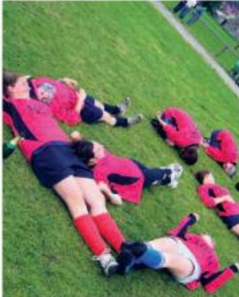
Après une finale épineuse, les filles de FEEL peuvent souffler. ■ M.D.E.

L'événement le plus prisé de la vie étudiante montoise a donc vécu une dis-septième édition. Vingt équipes de garçons, dont Valenciennes et Lille, sept équipes de filles et trois "folkloriques" ont donc défilé durant quatre jours sur les pelouses du FC Havré, à l'été de l'épreuve depuis 2005. Même les professeurs de l'UMH n'ont pas hésité à venir taper dans le ballon avec les étudiants lors d'un match épineux remporté par... les profs ! C'est dire l'esprit qui a régné entre ces étudiants venus des quatre coins du royaume. Le stand barbecue a tourné à plein gaz et la buvette à plein régime. Les coquettes installations de club de Fred Berpoel ont baigné dans l'univers des étudiants qui parviennent à combiner le festif et le sportif. D'ailleurs, l'organisme "don de sang" était présent lundi dernier afin de sensibiliser les jeunes. La compétition était assez relevée. Il est vrai que parmi les étudiants, il y a une légion de "buteurs". Les soirées ont également été l'occasion de moments mémorables. Plus de 300 jeunes se sont donné rendez-vous tous les soirs dans les endroits à la mode de la cité montoise. »